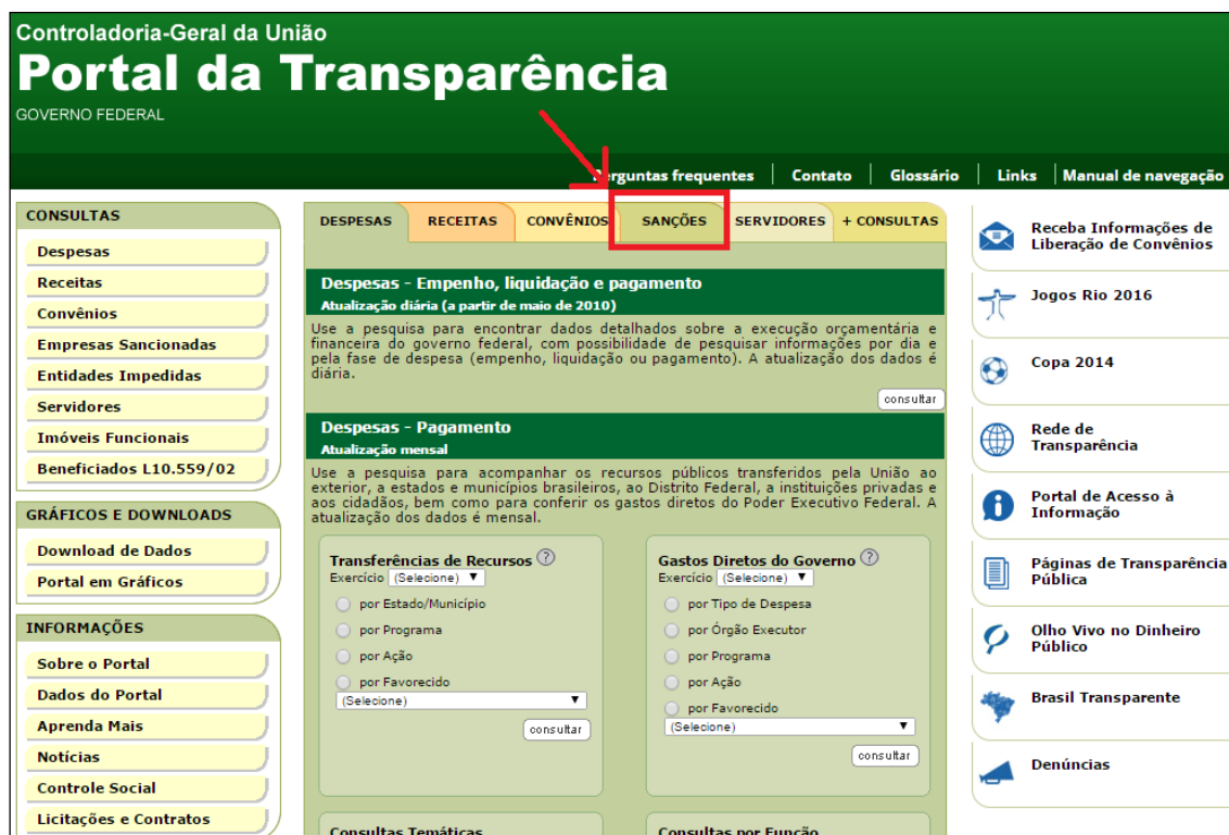
Tela inicial do Portal da Transparência, com destaque para a aba na qual fica o CEIS

O endereço direto do CEIS é http://portaltransparencia.gov.br/ceis/Consulta.seam . Note que ele fica hospedado no Portal da Transparência, podendo ser acessado pela página inicial do Portal ( http://portaltransparencia.gov.br ), na aba “Sanções”: