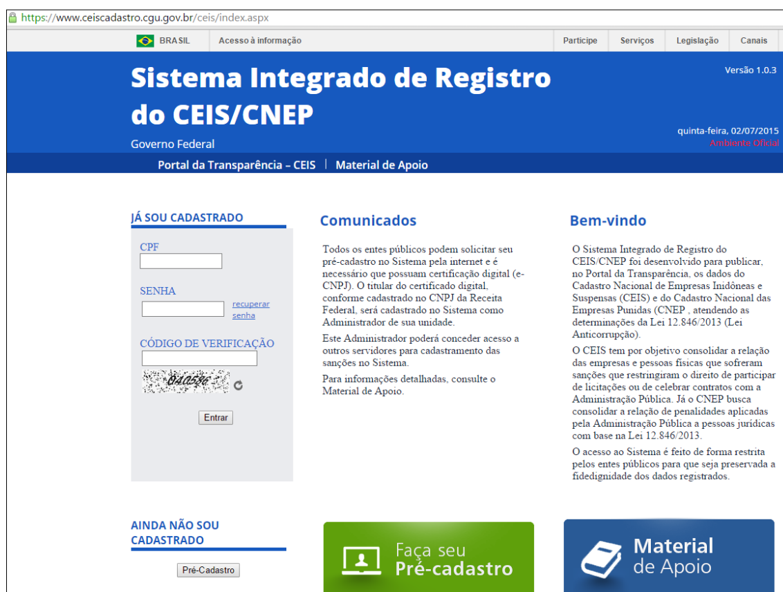
Tela inicial do Sistema.

Ministério da Transparência, Fiscalização e Controladoria-Geral da União, que também tem material de apoio e treinamento: http://www.cgu.gov.br/assuntos/responsabilizacao-de-empresas/sistema-integrado-de-registro-do-ceis-cnep :